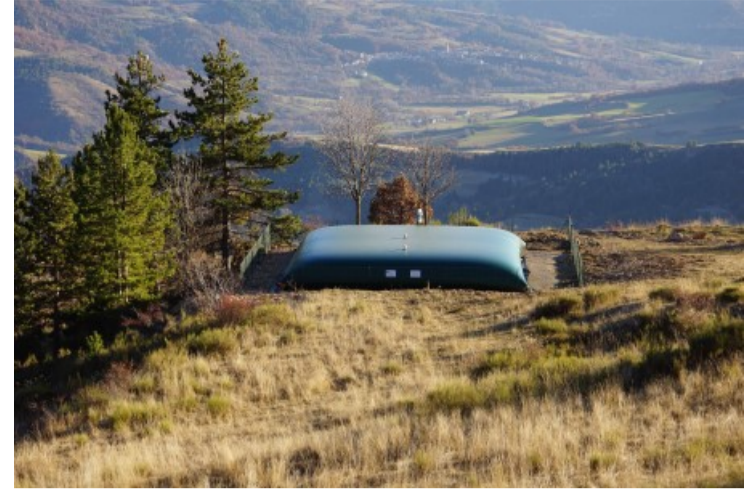
Réserve de 150 m3 d'eau dédiée à la défense incendie du haut -Mélan