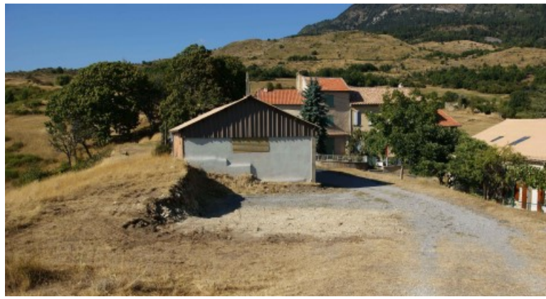
Fin des acquisitions de parcelles privées en enclave du chemin de l'église. Création de places de stationnement.