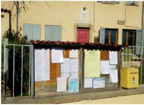
Le Castellard- Le Village MAIRIE