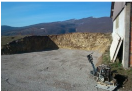
Création de deux places de stationnement en mars 2015