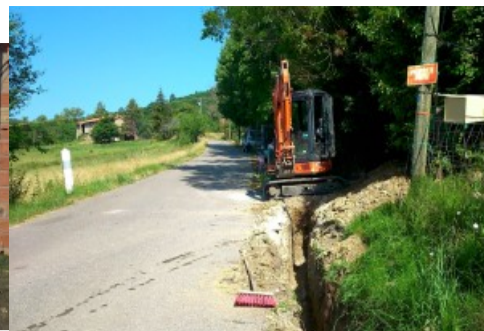
Remplacement canalisation entre vallon du Haut Chapus et Les Colons Août 2015