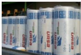
Isolation des combles réalisée en décembre 2014