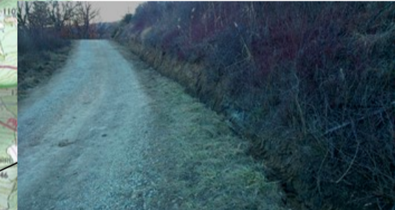
Chemin du Villard Août 2015