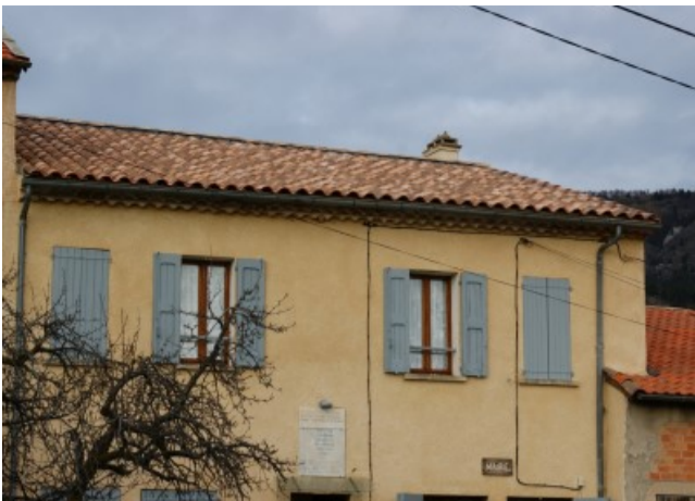
Toiture de la Mairie en septembre 2014