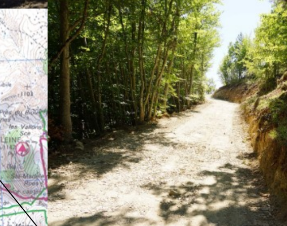
Limite sud de la commune