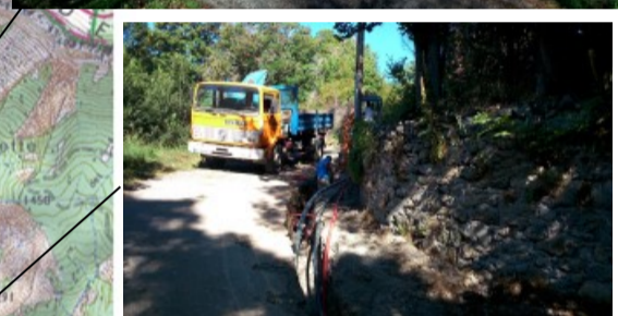
Réfection 55ml du réseau d'eau en traversée du hameau de Mélan en septembre 2014