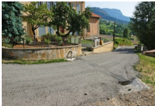
Remplacement et normalisation des 2 réseaux d'eau du hameau et création d'un collecteur des eaux pluviales aux abords de la Mairie