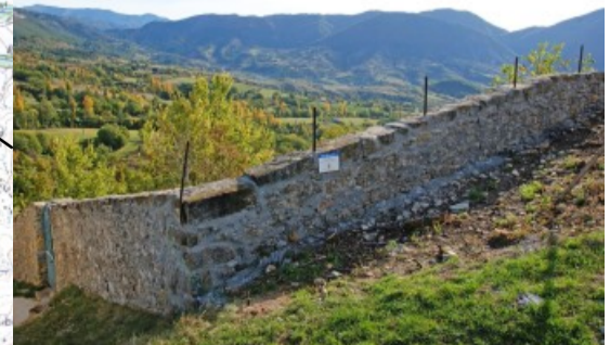
Etanchéité haut de mur du vieux cimetière du Castellard et un escalier de bouclage du sentier autour de l'église.