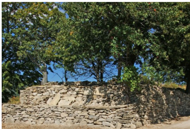
Murets en bordure de la placette et route départementale 17 à Castellard-Village