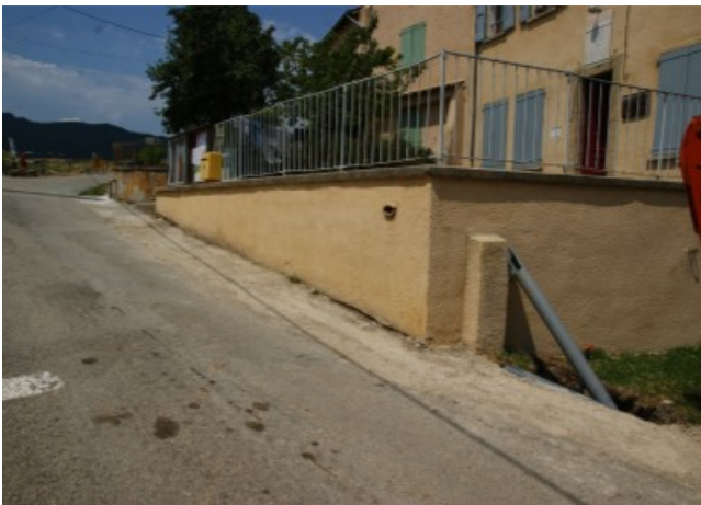
Enfouissement des réseaux humides (pluvial et réseaux)