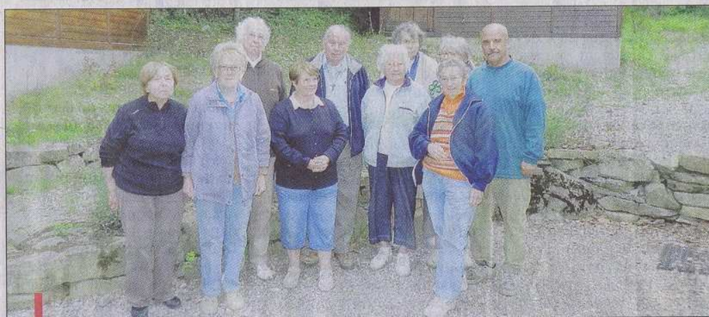
Les membres de la Fraternité de Mélan devant leurs bungalows, dont l'un porte le nom de la Princesse Grace de Monaco puisqu'elle l'avait financé dans les années soixante-dix.