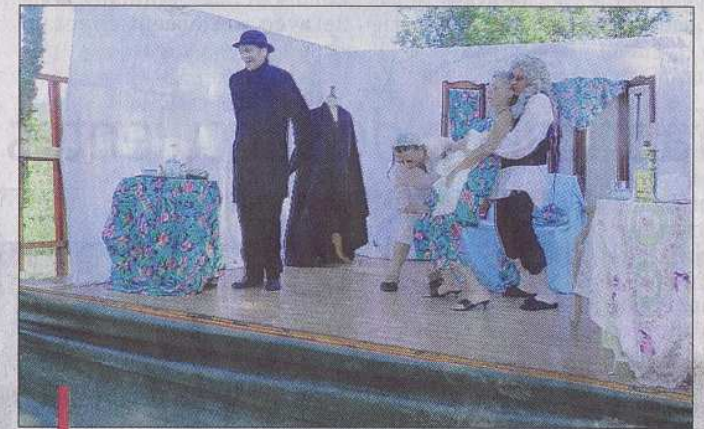
Une mise en scène en plein air qui a séduit le public.

Les acteurs de la Compagnie "Une sardine dans le plafond" ont séduit le public.