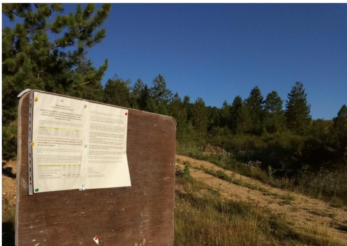
Prise de vue du 3 juillet 2017