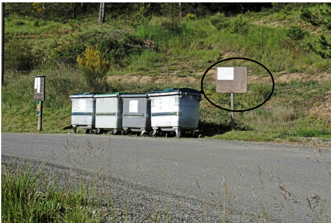
Prise de vue du 23 mai 2017