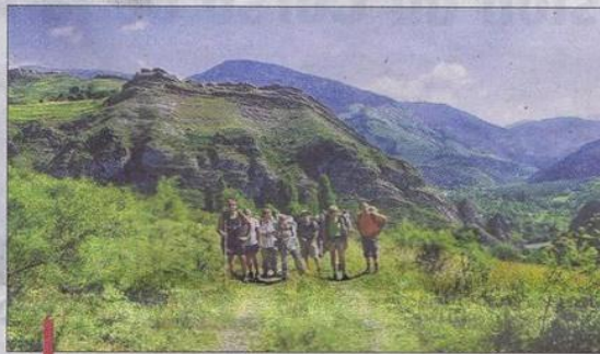
Le groupe de randonneurs partis d'auzet, dans la montée vers les Cloches de Barles. En fond, Barles et la vallée du Bes.

pas en montagne. Une goutte de genépi et on rejoignait le village où se poursuivait la fête avec les stands des producteurs locaux, le concert de Cantalma à l'église et l'apéritif dansant animé par les Toto Boys.